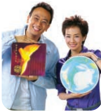
聖安娜委任影視紅人鄭丹瑞先生及毛舜筠小姐為月餅產品代言人