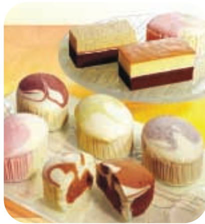
鴛鴦滋味鬆軟蛋糕

集團之節日產品質素明顯較國內競爭對手為佳，其營業額錄得80%增長。2間新餅店已於廣州開業，而現有餅店飽餅產品之營業額亦不斷錄得增長。為支援當地餅店之增長，一間新工廠已於2005年3月投入運作，我們現時可集中精力找尋合適位置擴展我們之餅店數目。